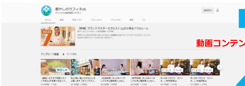
採用広報用YouTubeチャンネル