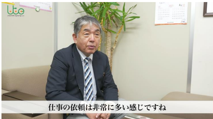
インタビュー動画

入社してきてからというもの、仕事は本当に大変です。最初は本当に大変な仕事でしたが、今はもう慣れてきました。今はもう慣れてきました。