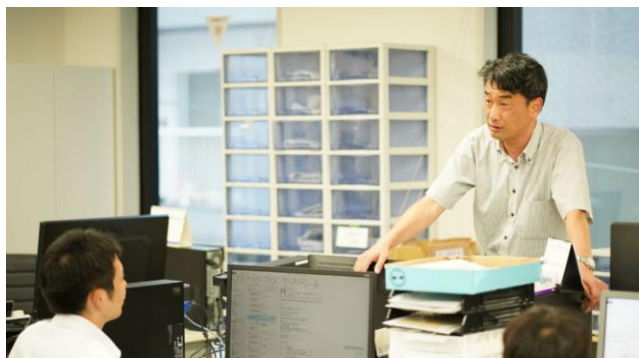
採用サイトインタビュー画像