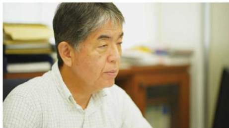
採用サイトインタビュー記事