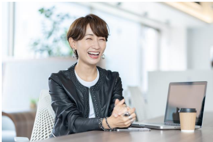
インタビュー動画・記事